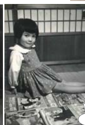
ディズニーの絵本を前に