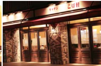
レンガの壁、カフェカーテンの醸すレトロな雰囲気引き込まれます