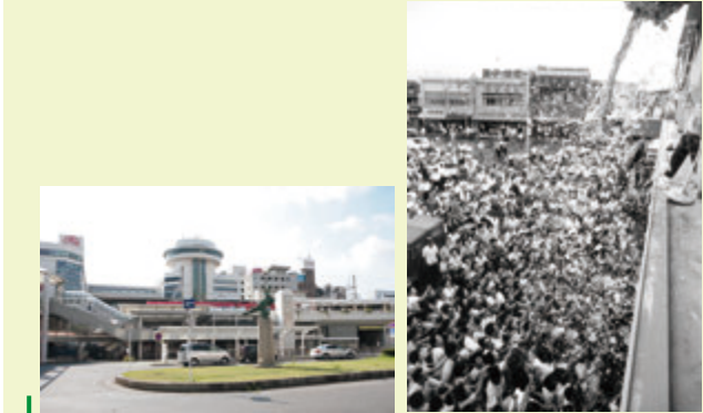
◆写真上: 竣工間もない頃のトヨビル。昭和45年には4階建てに増築された◆写真下右: 昭和36年のトヨビル竣工時は押すな押すなの大盛況◆写真下左: 昭和60年、高架駅となったことに合わせ駅舎も改修、現在に至っている。