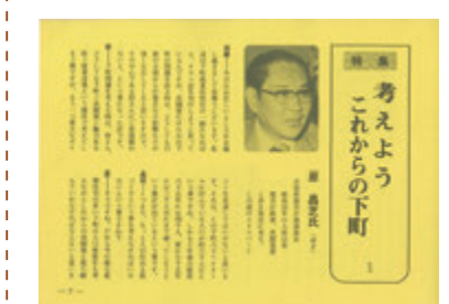
創刊号、原課長のインタビューページ

豊田初のタウン誌をつくると思気込んだのはいいが、先立つものがない。誰も金の工面なんか考えなかったが「下町限定のタウン誌をつくる」ということで商売屋さんに年会費で協力してもらおう」と無茶な意見が通った。