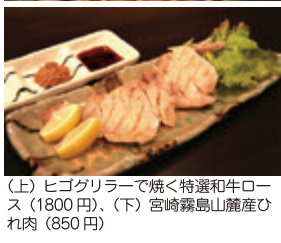
(上) ヒコグリラーで焼く特選和牛ロース (1800円)、(下) 宮崎霧島山麓産ひれ肉 (850円)