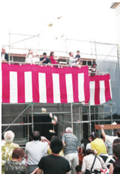
豊之介さん、踏まれる前に退散できて何よりでしたね...