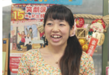
豊田のお笑い劇団「笑劇派」で人気上昇中