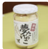
夢かけ風鈴のまち旭編

平成23年、商工会の部会「旭夢づくり研究会」によって生み出されたのが「夢たけのこ」。この地で育つ淡竹を使い、水煮した瓶詰めです。無添加で「えぐみ」が少なく歯切れ、風味が良いのが特徴です。