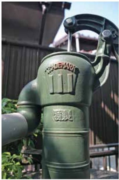
【注】人間の飲み水ではありません

「呼んだかん？ ああ、あれかん、地下水をくみ上げるポンプだわ。人間はむかし地下水を使っていた。この辺は地下