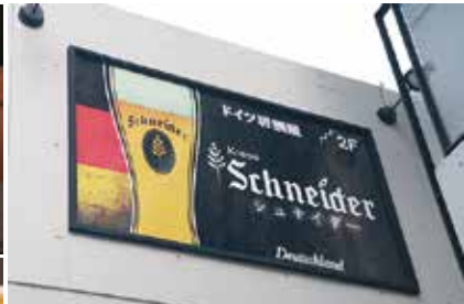
建物の階段を上って行くと、ドイツ国旗をイメージする看板が

ドイツ産のビール&ソーセージで気軽な時間が過ごせる「シュナイダー」。メニューにはポトルビールがズラリと並びます。生ビールは、フルーティーで飲みやすい「フランク」が人気。ワインも揃い、カクテルメニューも豊富です。ソーセージもドイツ直輸入のものも多種用意し、グリル、ボイルなどの調理法で提供。カレー粉を隠し味にした「カリーブライ」トヴルスト(700円)が自慢メニュー