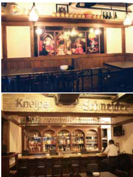
ゆったりしたテーブル席(上)と、座り心地にこだわったカウンター席(下)

「反重力 浮遊 | 時空旅行 | パラレル・ワールド」展 抽選で10組20名様に入场券プレゼント! ご希望の方は「まちなかPRESS」編集部まで、メールまたは郵便でご応募下さい。詳しくは、本紙P4をご覧ください。