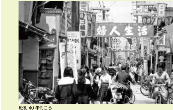
昭和 40 年代ころ