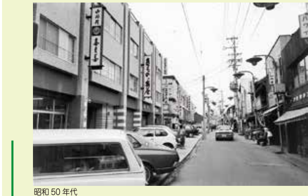
昭和 50 年代

道の両側に専門店がズラリ並ぶ竹生通り。 かつて竹生通りは、両側にお店がぎっしり並び、特に昭和 40 年代は、人・車の往来も盛んでした。今に至るまで、洋品店、書店、お茶屋、家具店など専門店が軒を並べています。 四郷町の M さんは「日曜日などに、親に連れられて「まち」に行っていました。写真に残るこれらの時代は、まだ道幅が狭く、そのことでまちと人が「近い」ところで共存していたように思います。」