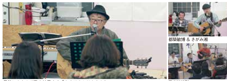
足助にちなんだ歌を披露する「あすけのかじやさん」 歌楽特捜隊

豪華景品が 駅前商店街の歳末抽選会 12/13(金)から! 駅前商店街の冬の恒例イベント「歳末抽選会」が始まります。抽選券は順次配布、抽選会は夢現屋にて12/13(金)~12/15(日)の11:00~18:00(最終日は17:00まで)。抽選券1枚でくじ1回。景品は最高賞がテレビ、空くじなしです。