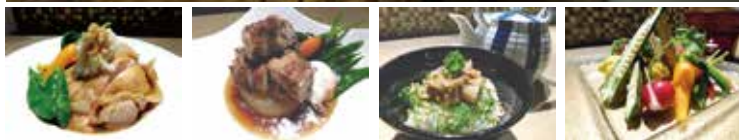
「奥三河どりの低温調理した煮付けおろしポン酢添え」(最左 1200 円)ほか地元産食材、有機野菜をつかった料理が味わえる。料理はどれもボリュームたっぷり満足感あり