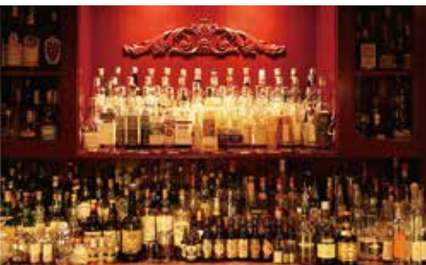
1950年代のオールドボトルも含めストックは500本以上

ショップ情報 住所 昭和町 4-18-1 ☎ 33-0138 火曜 休 チャージ 500円、ショット 500円 ~ *営業時間は曜日ごとに異なります。日曜は夕方4時から。待ち合わせに使う、食前酒を一杯のような利用ができそうです。 [月、水、木] PM6時~AM2時 [金] PM6時~AM3時 [土] PM5時~AM2時 [日] PM4時~AM1時 *1グループ4名まで