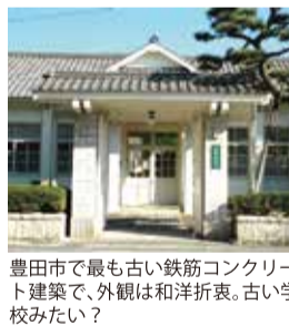
豊田市で最も古い鉄筋コンクリート建築で、外観は和洋折衷。古い学校みたい?

「愛知県蚕業取締所第九支所。これは喜多町4にある。豊田市近代の産業とくらし発見館」が大正10年に建てられた時の名前です。かつてのまちは養蚕が大変盛んで、ここでは蚕の病気予防検査や品種改良など