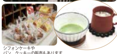
シフォンケーキやパン、クッキーの販売もあります

は再開で取り壊しの決まった北区の店や人を記録に残す、という意味も込めて10本ほどの短編映画を作ります。秋には中心市街地のどこかで上映会を開く予定です。ぜひお越し下さい。