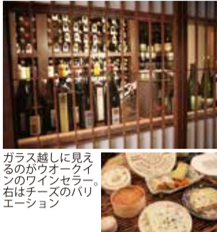
ガラス越しに見えるのがウオーキングのワインセラー。右はチーズのバリエーション