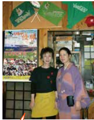
つばさや時代です。開店当時から 変わらず、毎日和服でお店に出 てらるんですよ。