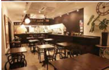
「季節の良い時期は扉をオープンにしています」と店長。通りがかりに気軽に入れる雰囲気