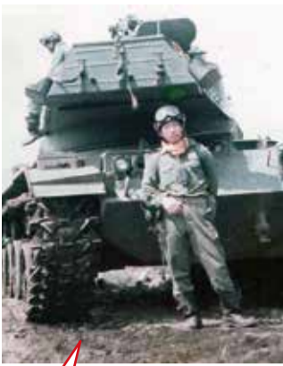
念願かなって戦車隊として活動。訓練は厳しかったけど、楽しかったです!