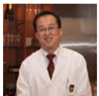
ワイナリー産を主に使用。目に見えない部分にまで心を

肉や魚が良質であることはもちろん、野菜は松平産の無農薬を、オイルはイタリアの「おまかせコース」は4500円、5500円、6500円の3通り。その日の仕入れで折々に変わる単品もあります。ワインはグラス800円から。彩りも美しく季節感満載。ワインが自然に進みます。