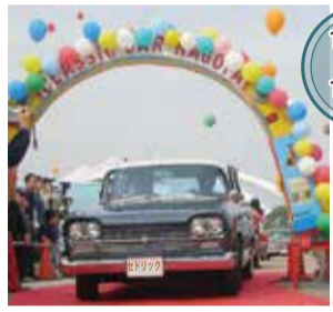
10:30 ~ 16:00