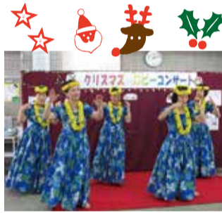
クリスマスコンサート出演者募集

12月19日(金)~21日(日)に開催される、恒例の「クリスマスコンサート」に出演してみませんか。楽器演奏、コーラス、ダンスなど、内容は自由。昨年マジックショーやスイーツデコ体験などもありました。個人でもグループでも出演できます。ステージは各日10時から20時のうち20分程度。申込みは崇化館交流館(TEL 33-0750)まで。