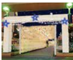
イルミちゃんピンパッジ 取り扱いスタート <P3をご覧ください>

自衛隊で2年務めました。子どもの頃から作るプラモは戦車ばかりで、戦車隊になりたくてね。ラッパ吹きもやって、地元に戻り挙母祭りで吹きました。今に生きるいい経験でした。 「西町あおいや」は、お袋の味を売りに、もう30年近く。気軽な店ですよ!