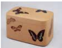
黒田辰秋「彩漆群蝶團手篋」1948年 豊田市美術館蔵

●京都市出身で、木工芸の人間国宝となった作家について、所蔵作品を中心に話し。【講師】西崎紀学芸員