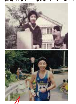
石巻マラソンに参加 38 才。結果は…無事に完走でした。