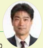
榎原税理士事務所 豊田市東梅坪町8-8-21 新見ビル2F/TEL42-5200

相続税の基礎控除額が、平成27年から減額されます。 平成26年12月31日以前 5,000万円+1,000万円×法定相続人の数 平成27年1月1日以後 3,000万円+600万円×法定相続人の数 相続となれば、普段お付き合いのない税理士や司法書士などをお願いすることになると思います。ところが相続税では、財産評価が複雑で、様々な特例もあり、諸々の条件や資料の提出が求められます。土地の評価については、高度な専門性が求められ、税理士によって差があり、評価次第で税額が変わってくることもあります。扱い慣れていない税理士等への依頼は時にリスクを伴います。 依頼の前に、得意分野を調べる、知り合いに聞いてみるなど、十分に検討されることをおすすめします。