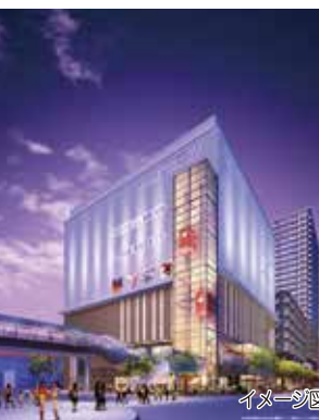
写真左に伸びるデッキが、GAZAビル南のデッキにつながる予定です

再開発地区の店舗移転などが進み、2015年はいよいよ建物解体が始まります。約3年後には、シネマコンプレックス(複合型映画館)を含む商業・業務棟、高齢者施設棟、住宅棟が並び、新しい駅前の顔としてお目見えする予定です。