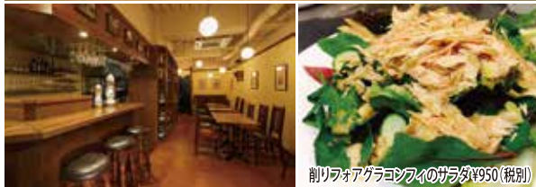
削りワオアガラコンフィのサラダ ¥950(税別)