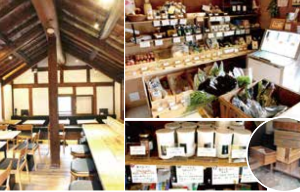
10品目夢農人ケトル野菜のサラダプレート980円(税別)