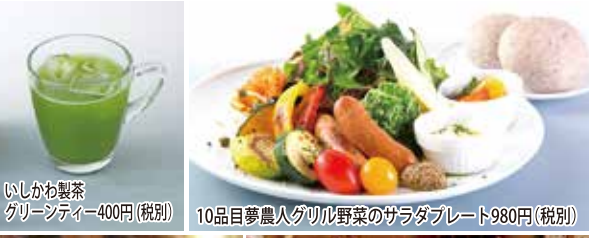
いしかわ製茶 グリーンティー400円(税別)