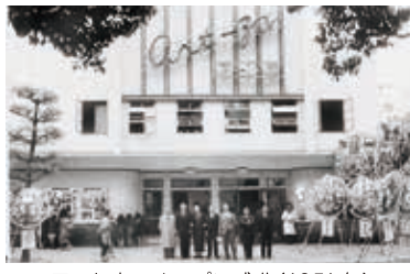
アート座のオープン式典(1951年)

某映画評論家の言葉ではありませんが「映画って本当にいいもの」だと思います。心に残る物があります。社会人になり忙しくなると郊外のシネコンまで出かけるチャンスが減り、あまり映画を見られなくなり、この街でいつでも映画が見られる街になるって嬉しいですね。