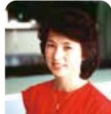
ホテルオープン頃