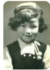
とびっきりのお洒落して！