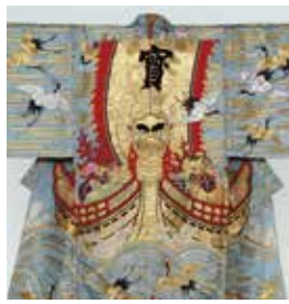
宝船と鶴紋が刺繍された打ち掛け

昭和町2丁目から、昭和町4丁目にお嫁入りしましてね、今68歳です。ここに載せていただくのに写真の整理をしていて、懐かしい写真が出てきました。表紙の写真は大学1年の頃です。