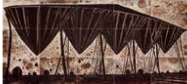
山口啓介《RNA World—5つの空 5つの海》1991年