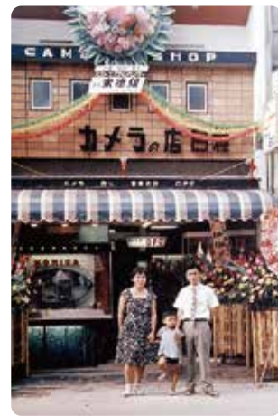
昭和37年、店舗改修オープンの時

「けつかった」 「爺ちゃん、昔の車の写真見たら三角の窓があるけど、あれ何?」 「あれを開けると爽やかな風が入ってくる窓だがや。夏は涼しかったなあ。雨の日はアカンかったけど」 「アコンはなかったのか?」 「ほんなもんあらずか。窓も手でくるくる回さんと開け閉めできんかったしなあ」 「おう、かつこいいじゃん。爺ちゃん何歳から車に乗った?」 「かつこなんか良くないわ。オートマじゃやないで変速レバーから手を離せんし、ハンドルも重かったし。ほだなあ、仕事で二十歳の頃から乗ってつたけど、よく壊れたわ。ブラゲなんかしょつちゅう掃除して調整したもんだわ」 「自分で直したのか。スゲー」 「はいでも車は進化したなあ、こないだも婆さんと歩んどつたら音のせん車が後ろからスーッと来るもんだで、