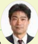
榊原税理士事務所 豊田市東梅坪町 8-8-21 新見ビル 2F /TEL42-5200