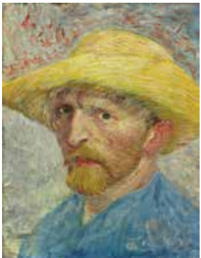
フィンセント・ファン・ゴッホ「自画像」1887年 City of Detroit Purchase

全米屈指の美術館のひとつ、デトロイト美術館の6万5千点を超えるコレクションの中から、モネ、ルノワール、セザンヌ、ドガ、モディリアーニ、ピカソ他、近代絵画の巨匠たちの選りすぐりの作品を紹介。ヨーロッパから合衆国に「初めて到来した」ゴッホやマティスの名品も必見です。