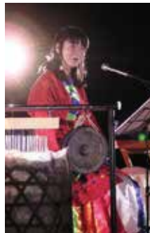
でも普段の私は、人の顔や名前が覚えられないし、難しい話には通訳がいります。失敗することもあって、母に厳しく叱られます。

でも普段の私は、人の顔や名前が覚えられないし、難しい話には通訳がいります。失敗することもあって、母に厳しく叱られます。落ち込むのが続くと「あなた、語りやめるんか?」と言われる。でも、いくらへこんででも、冗談でも、「やめる」とは言えませんが、今までもこれからは、母がいてくれて道がある。語りをやめたら私には道がなくなるんです。