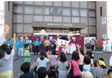
崇ちゃん登場で一気に盛り上がり(昨年の様子)

年に一度の崇化館交流館のおまつり「夢フェスタ」が、9月25日(日)開催されます。今年のテーマは「あいさつと笑顔 地域を結ぶ 崇化館」。当日オープニングで、このテーマを書道パフォーマンスにて披露します。