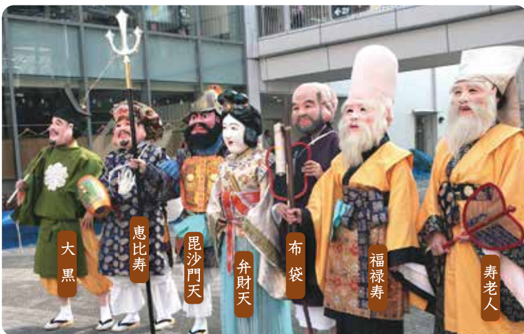
大黒 恵比寿 毘沙門天 弁財天 布袋 福祿寿 寿老人

われら挙母祭り喜多町名物「七福神」。 さあ踊りにご相伴、福をもらいにきておくれん。 挙母祭りで今年「華」を務める喜多町。その名物「喜多町七福神踊り」を披露してください。七福神の皆様に、まちでバッタリ会いました。この機に踊りの由来などをうかがいました。