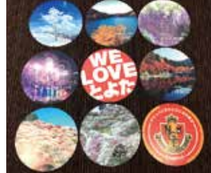
【上左から】面ノ木の樹木、三河湖、ふじの回廊、おいでんまつり、WE LOVE とよた、香嵐溪、小原四季桜、上中のしだれ桃、名古屋グランパス