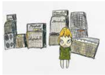
奈良美智『Marshall』2003年 個人蔵 ©Yoshitomo Nara 2003

奈良美智(よしとも)氏は、1987年愛知県立芸術大学修士課程修了。県芸を旅立ち、ちょうど30年目、2017年の展覧会は「自分にとっての遅すぎる卒業制作」。絵画、ドローイング、FRPや木彫などの立体、大規模な小屋のインスタレーションなど100点余りを展示しています。