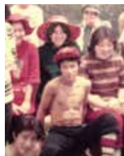
【左】真ん中のマツチヨナが私です。こんなにも体型が変わるとは…