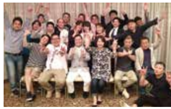
3年前、会社として新スタートした時のパーティー。この仲間あつてのお店です。ありがたいです。