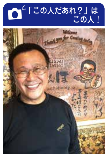
8月下旬に「ROBATA とんぼ」を豊田駅前本店(若宮町1)のすぐ近くにオープンします! 女性の方も気軽に来ていただけるお店です!