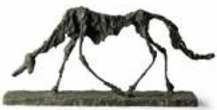
〔犬〕1951年 フロンズ マルグリット & エメ・マールグザン 美術館、サンポール・ド・ヴァン

ぎりぎりまで切りつめられ、引き伸ばされた立像が強烈に目に飛び込んできます。10月からの企画展は、第二次世界大戦後の彫刻史に決定的な位置を確立したアルベルト・ジャコメッティ (1901-1966年)の回顧展です。