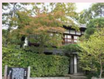
旧料理旅館・喜楽亭(豊田産業文化センター内)

喜楽亭は戦前は養蚕業、戦後は自動車産業の関係者が多く利用したと伝えられていますが、枝下用水もまた喜楽亭を歴史舞台としてきました。