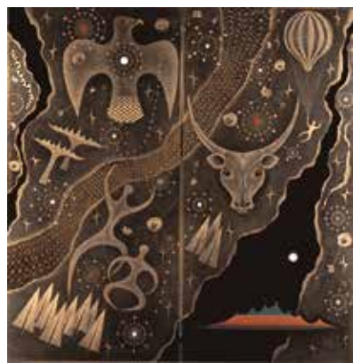
高橋節郎《満天星花》1992年 鎗金、蒔絵、螺鈿 安曇野高橋節郎記念美術館蔵