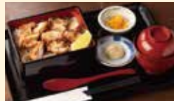
日替わり重(680円)、その他種類あり。ご飯大盛り無料!