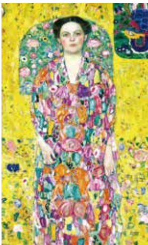
グスタフ・クリムト 1913/1914年 油彩、カンヴァス 140×85cm 豊田市美術館

展示代表作の一つ《オイゲニア・プリマフェージュの肖像》は豊田市美術館所蔵作品で、クリムトの後期肖像画の特徴を示すものです。色とりどりの花を用いながら、背景右肩には東洋の置物をモチーフに鳳凰が描かれています。他作品と併せて鑑賞すると作風の変化や思考の深みを感じ取れるのではないのでしょうか。