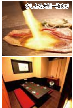
さしどろ大刺一枚盛り