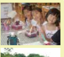
摘み取り体験で、ピオトープ公園もあわせて見学できます

今年の開園は7月13日(土)。開園期間中は摘み取り体験ができて食べ放題!ブルーベリージャム教室では「自分で作って食べる地産地消費」が体験できます。