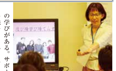
6月に参加した女性リーダー育成の合同型研修でプレゼンテーション。やること、進む道が明確になった

学校へ行くことが必ずしもゴールではない。昨年秋から「遊び場・学び場 たらす」という場を設けています。私自身、学校に行かない時期があり、強い風当たりで悲しい思いをした経験があります。その気持ちをわかってくれる方と出合い、「与えらるる学び」じゃない「得る学び」を目指し、スタートしました。何より「安全安心な居場所」であることを基としています。大学で教育学を専攻し、家の傍ら非常勤講師として十数年教壇に立ち、「学び」の多様性を掘り下げてきました。「たらす」では、例えばボードゲームもするんですが、「一人狼ゲーム」のような心理戦ゲームでは人の心の動きについて