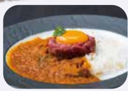
キーマカレー(880円)は、大人から子どもまで連日オーダーの多い一品