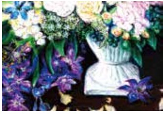
[フラワーアレンジメント]

作者は70代の女性です。素敵なお庭が自慢の可愛らしい方です。いつもお花に囲まれていらっしゃるの、毎回描かれる花の絵も、傑作揃いです。