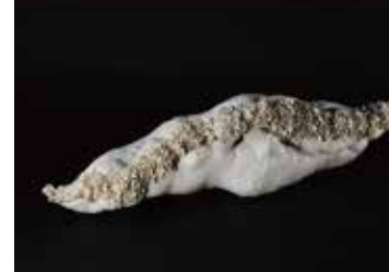
旗 寿恵 / 陶芸作品

豊田に生きるアーティストが、このまちに培われた産業や文化を背景に制作した作品を、歴史的建造物を会場に披露する作品展「アートデイズとよた 2019」が10月14日(月)まで開催されています。