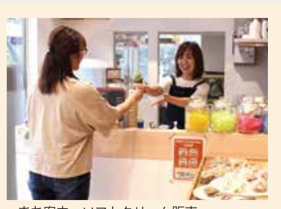
まち案内、ソフトクリーム販売 コンテナーニシマチ6 《愛称: エヌロク》

店探しから迷子まで 十人十色のお尋ねに対応 豊田に求められた方のインフォメーションスポットとして2年近くやってきました。店名は、この場所の地名「西町6丁目」から取っています。スタッフ3名も西町出身。在住で、市内各地の観光地や施設のこと、駅周辺の細い路地のことなど、日々の暮らしで身に付いた知識と勘で対応させてもらっています。日々本場にいろいろなお尋ねがあります。「郵便局に行きたい」「〇〇銀行はどこですか」「迷子になっちゃって」のように、内容は十人十色。「前に行った店に行きたいんですが、場所も店名もわからなくて」