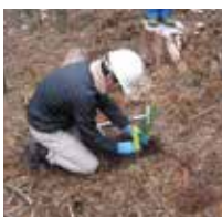
少花粉スギの苗を植えています

スギ花粉が既に飛んでいます。今豊田の山では、新しく開発された「少花粉スギ・ヒノキ」の苗の植林を進めています。花粉を飛ばしている30年生以上の木を伐採し、少花粉タイプに植え替えていけば、やがて花粉飛散量削減へ。そのためにも、国産材利用が進むよう、整備とPRに努めています。61-1616 (豊田森林組合)