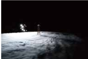
劇場作品『らせんの練習』2019年ロームシアター京都

1981年生まれの新進作家、久門剛史(ひさかど・つよし)の、インスタレーションによる新作個展です。