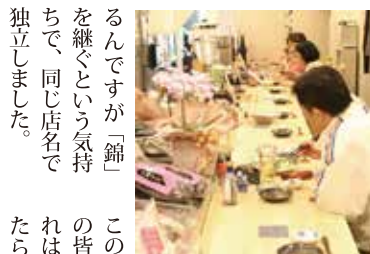
●喜多町 3-87(三笠ビル) ●TEL 41-3317 ●17:00~23:00(土曜は24:00まで) ●日曜休