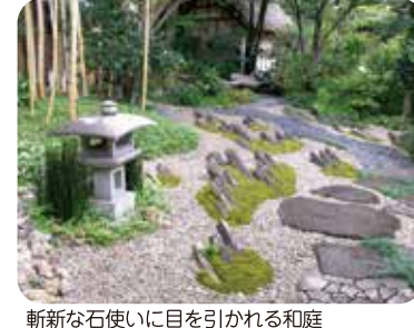
斬新な石使いに目を引かれる和庭

花・庭づくりワンポイント 竹の処分は除草剤なしに 3年ほどのおつきあいで 庭の中で必要でなくなった竹類の処分は大変です。掘り取って処分することはとても重労働です。 除草剤も使わずに竹を絶やすには伸びている竹を切り取り、次にまた伸びた竹を切り取ります。これを3年程度続けると、竹は新しい芽を出し続けることによってエネルギーを使い切って、自然に絶えていきます。笹の仲間の処分も同様に行います。