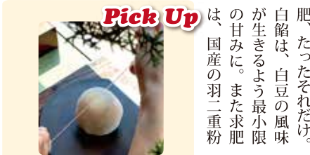
「餅切り糸」で自分でカット!