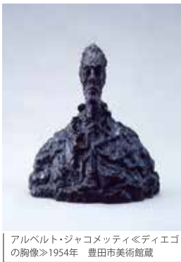
アルベルト・ジャコメッティ「ディエゴの胸像」1954年 豊田市美術館蔵

見る者の遠近感を軽やかに翻す福田美蘭の絵画、距離を彫刻に持ち込んだアルベルト・ジャコメッティの胸像[写真]、時空間をいかに把握するか問いつけた若林奮の彫刻など、距離を想起させる作品をピックアップしています。鑑賞を通して、距離の感覚を解きほぐし、遠くを思うこと、近くを見つめる感覚をリセットできるかも。