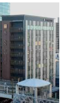
「カフェ・ド・クリエ」はP2に記事があります。

そんな思いもあつて昨年秋、代々受け継いだ土地、豊田市駅の目の前に「アットインホテル」を誘致しました。多くの提案を受けた中で、まちのランドマークの一つとして、また回遊の「止まり木」機能を備えるようにという思いで模索しました。もちろん、一人の力では到底できなかった。隣接する土地所有の方をはじめ本場に多くの協力があつて成し得たこと。感謝の一言に尽きます。1階に誘致したのがカフェ・ド・クリエ。この施設が、まちの賑わいづくりの一助になればと思っています。