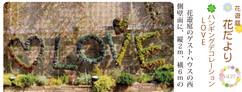
花遊庭 花だより ハンギングデコレーション LOVE Vol.27 花遊庭のゲストハウスの西側壁面に、縦2m、横6mの

大型のハンギングデコレーションを設置しました。大小二つのハートと「LOVE」の4文字を、色とりどりのビオラの花で飾り付けています。 ひとつひとつの文字は、太めの針金と金網によって骨格を作り、内側にヤシマツトで個々の植栽スペースを作りました。花色も文字ごとに変化をもたせてあります。今回のような大きな花文字を壁に飾るといことはあまり前例がないため、作成には苦労の連続でした。コロナ禍の現状において、この花飾りをご覧になり少しでもほっとするような暖かい気持ちと、一足早い春の訪れを感じていただければと思います。