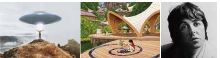
● CAFE Y GALERIA 風華 / 刈谷市今岡町東畑 45-1 ● 10:00~17:00 ● 金・土休 ● 0566-36-7928