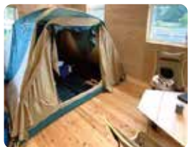
親の集まりの会場のひとつ。同伴する子どもたちに室内のテントが人気です