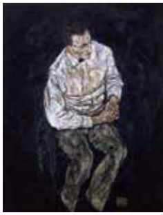
エゴン・シーレ《カール・グリュンヴァルトの肖像》1917年 油彩、カンヴァス 豊田市美術館蔵