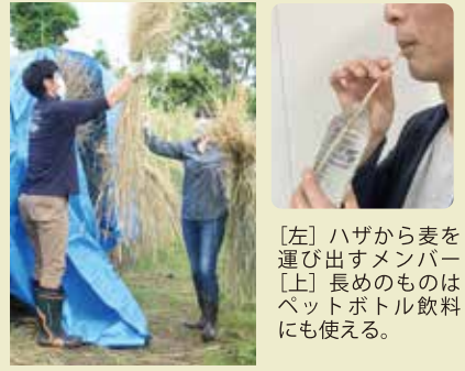
ハザから麦を運び出すためのバットにも使える。