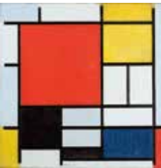
ピート・モンドリアン『大きな赤の色面、黄、黒、灰、青色のコンポジション』1921年 油彩、カンヴァス、デン・ハーグ美術館

20世紀を代表する画家のひとり、ピート・モンドリアン(1872-1944)。垂直水平の線と、三原色、無彩色で描かれた「コンポジション」シリーズは、絵画史の転換点ともとらえられています。初期の風景画、40代半ばから描き始めた抽象画、「コンポジション」へと至った軌跡を、画家の誕生から150年を迎えるこの時期に振り返ります。同時期に、ともに幾何学的な表現を挙げたテオ・ファン・ドゥースブルフやヘリット・トーマス・リートフェルトらの作品も展示します。