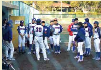
試合後のミーティング。これもチームワークの礎に