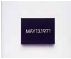
河原温「MAY 13, 1971 Todayシリーズ (1966-2013) より」1971年 アクリル、カンヴァス

日本を代表するコンセプチュアル・アーティスト河原温を中心とした「時」に関わるコレクション展が開催中です。河原は1932年刈谷市生まれ。その日のうちに当日の日付を描く「デイト・ペインティング」に取り組みました。豊田市美術館所蔵の一月分の作品は、制作が1971年。時間と空間の切り離せない関係がどう捉えられているか、半世紀を経たいま、作品の前に立ち感じてみてはいかがでしょうか。他にボリス・ミハイロフ、ライアン・ガンダー、杉本博司などの作品を展示しています。