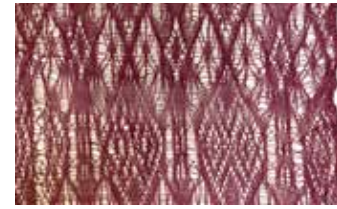
織り目の細かい部分と粗い部分は、経糸の寄せ方を変えることで現れる。織物ながら奥行きがあり、繊細で上品な風合いの羅織り