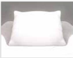
小林孝巨「Pillow」2021年、油彩、カンヴァス、91.0x117.0cm(作家蔵)