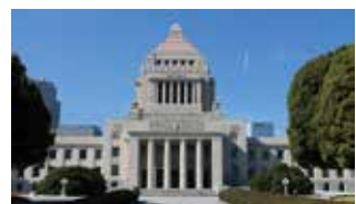
リカからお召しいただいたのが現在の日本国憲法。ここで考えてみたいことは、世界では長い歴史の中で他国の制度を模倣したもの、あるいは国情に合わなくなった「決まり」は、廃棄もしくは改正されてきたのが通例だ。ましてや押し付けられたものをいつまでも堅持して単純に平和憲法とあがめてしまっているものかという懸念がある。

その後、平安から明治までの約一千年間でその時代環境にマッチした己を律する「決まり」をつくっては改正して日本のきまり制度は変遷してきたと考えるといいだろう。