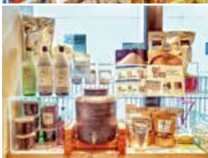
フォーユー商品も扱っています。