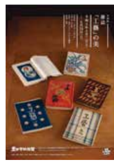
住平戸橋町波岩86-100 9:00～17:00 45-4039 月曜(7月18日は開館) 無料