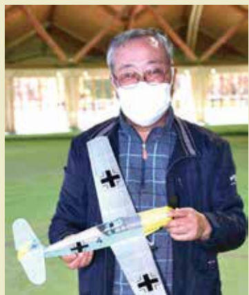
豊田人力飛行機研究会with 滝っ子