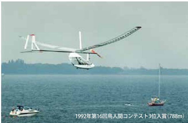
1992年第16回鳥人間コンテスト3位入賞(788m)

人間の脚力でプロペラを回し風に乗って空を飛ぶ「人力飛行機」づくりに40年携わってきた濱田さんに、その魅力などを伺いました。