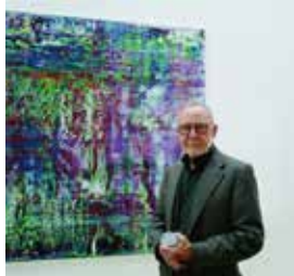
ゲルハルト・リヒター (2018年)

1932年、ドイツ・ドレスデンに生まれたゲルハルト・リヒターは、一貫して絵画を手掛けながらも、身近な写真を拡大して描く(フォトペインティング)、ガラスや鏡を用いた作品、巨大なカラーチャート、そして抽象絵画など、今日絵画が持つ可能性を最大限に展開しながら制作を続けてきました。90歳を迎える年に開催される本展。彼が大切に手元に残してきた作品を中心に、60年にわたる画業を紹介いたします。約140点による待望の回顧展です。