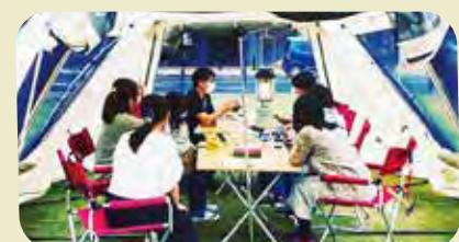
9/3(土)とよしばで開催した「ゆるっと♡ほけんしつ〜夢カフェ〜」の様子。

【今後の開催予定】 ★10/15、☆11/5、☆12/17、★1/28、☆2/25、 ☆3/18 (いずれも土曜、14時〜19時、★マーク： 参加館の中央図書館3階入り口前にて、☆マーク： とよしばにて。予約不要、お菓子の配布あり！)