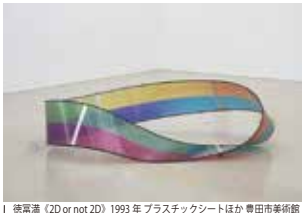
徳富満「2D or not 2D」1993年プラスチックシートほか 豊田市美術館

名古屋出身の徳富満(1966-2001)は、知覚と認識のあいだのちよっとしたズレや、物のかたちと同一性をめぐる思索を作品として提示するアーティストでしたが、2001年、病を得て35歳の若さで没しました。