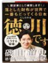
徳川です 磯田道史 著