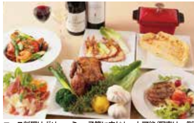
コース料理はボリューム。予算に応じセット可能(写真は一例)