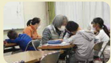
学校を終え、通ってくる子どもたち。この日、月曜日は小学校3・4年生の日。スタッフさんが子どもたち個々の習熟度にあわせ向き合っていた。