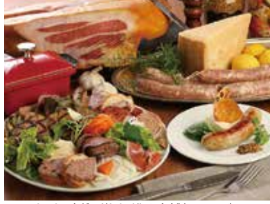
シャルキュトリ各種はどれも手作り。自家製ソーセージは935円