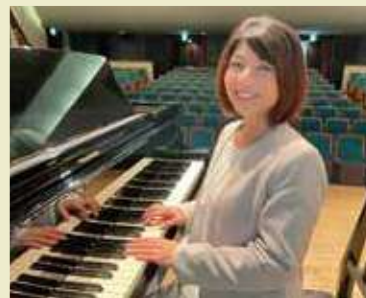
音楽教室はじまりの音