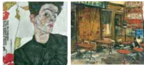
EGON SCHIELE 展 [上]佐伯祐三 1927年 レストラン(オテル・デュ・マルシェ) 大阪中之島美術館蔵 [左]エゴン・シーレ展のチラシ

25歳で渡仏後、フォーヴィズムの巨匠ヴラマンクを訪問して見せた裸体画に對し『このアカデミック！』と罵声を浴びせられた。佐伯の絵は、伝統的形式ばつていてと批判されたのです。この事件が佐伯の絵を大きく変化させることになりました。一年余りは、ヴラマンクやユトリロの影響を受けましたが、そこから脱し、独自の画風を模索しました。