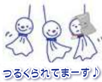
つるくられてまーす!