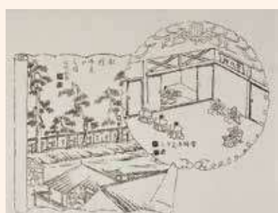
崇化館「射的御見分之図」(左)、「学問御見分之図」(右)