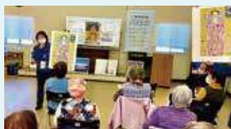
豊田市美術館所蔵作品に「こんな見方も」と解説

豊田市美術館の所蔵作品を「やさしく・深く・おもしろく」楽しむ講座を展開するアートフレンド。いま同会では「フレイル予防としてのアート鑑賞」に取り組んでいます。