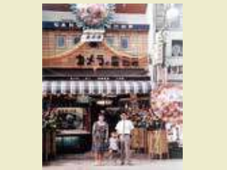
昭和37年、駅前通りの店の改装時、ご両親とともに