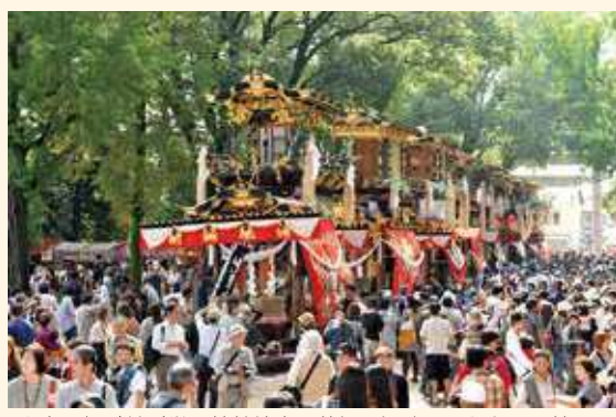
山車八輦が並ぶ挙母神社境内は壮観。観覧の人たちへの披露の場であり、山車が神輿渡御の帰着を待つ時でもある