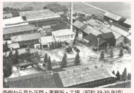
南側から見た正門・事務所・工場(昭和38-39年頃)