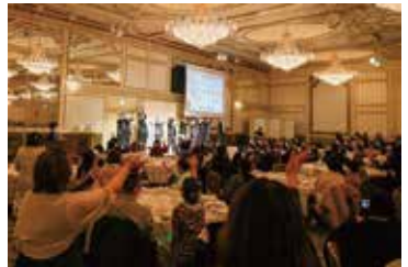
名古屋のホテルで開催したクリスマスショー。利用者さんの笑顔のため、スタッフは皆本気で！

声掛けを大事にしています。利用者さんの着ているものが数日同じとか、持ち物が増えたりというの、その人に何かが起こつたサインなんです。だから「変わったことないですか？」と寄り添うんですね。お伝えすべきこと、例えば大声出ししたりしたら