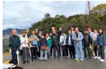
この日は犬山市へ行きました。ガイドボランティアを多めに編成し、視覚障がいの人を支えています。