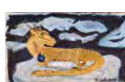
横山真久画 / 干支にちなんで可愛い竜を描きました

長を飛び越えて息子を後継者に定めたのです。道長政権の誕生 伊周に完全に先を越された道長であったが、その転機は突然訪れたのです。疫病が蔓延していた九九五年、閑白道隆が四月に、そして後を継いだ道兼(次男)も五月に死去したのです。一条天皇は権大納言に過ぎなかつた道長に内覧の旨を賜った。こうして道長はいきなり政権の座に就いたのです。道長の同母姉で一条天皇の生母である詮子の意向が強くはたらいいたのではといわれています。