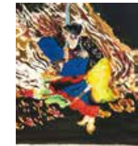
模写「大日本史略図会第十二代景行天皇 日本武尊」-天叢雲剣・草薙剣- /横山真久 画

美術館は原宿から歩いてすぐのところにありました。原宿について、少々思い出があります。名古屋大学三年生の時、当時所属していた野球部の七帝戦(旧帝国大学七校のスポーツ大会、現在の全七大学総合体育大会)が東京大学のグラウンドでありました。試合後、誰が言ったのか忘れてしまったが、原宿という所は、落ち着きがあると同時に