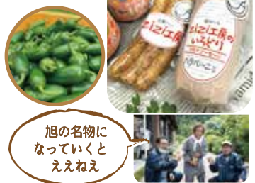
旭の名物になっていくとええねえ

旭地区産のハラペーニョ(青唐辛子)を使った「ハラペーニョウィナー」が誕生しました。