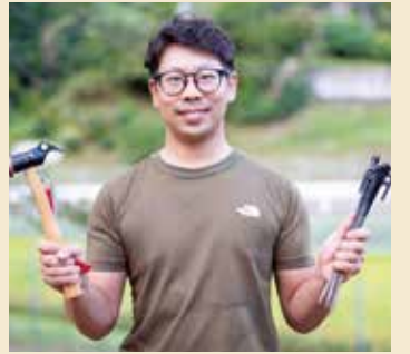
株式会社 野遊びヘルスケア 代表取締役 コミュニティナース、保健師、看護師、介護支援専門員